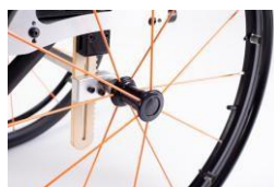
Centro de gravedad regulable en sentido anteroposterior y en altura