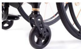
Angulo de casters regulable

La RAPID GT es una silla de ruedas compacta, cuadro fijo, plegado frontal y pedana única, ultraliviana, lo que facilita el manejo y reduce el esfuerzo al propulsar, diseñada para usuarios activos que buscan máxima eficiencia, maniobrabilidad y confort. Fabricada en aluminio 6061, con uniones mediante soldadura electrónica TIG, brinda una configuración rígida, liviana y resistente, optimizando la transferencia de energía en cada impulso y reduciendo el esfuerzo durante la propulsión. Su diseño anatómico y ajustable permite adaptarse a diferentes necesidades de posicionamiento, pudiendo configurar la silla con distintos accesorios posturales. Equipada con ruedas traseras inflables, llantas inyectadas en nylon, rodamientos de precisión con doble blindaje y eje de extracción rápida (Quick Release). Posee ruedas delanteras de 150 mm poliaire. Es ideal para personas con movilidad reducida que requieren una silla manual de alto rendimiento, especialmente aquellas con un estilo de vida activo, que buscan independencia, comodidad y libertad de movimiento tanto en interiores como en exteriores.