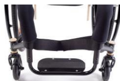
Apoyapiés único regulable en altura